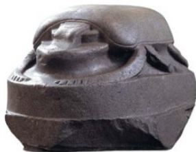
i Giant scarab statue, Room 4

As a reward for completing the trail, here's a special Egyptian creature linked to the rising sun.