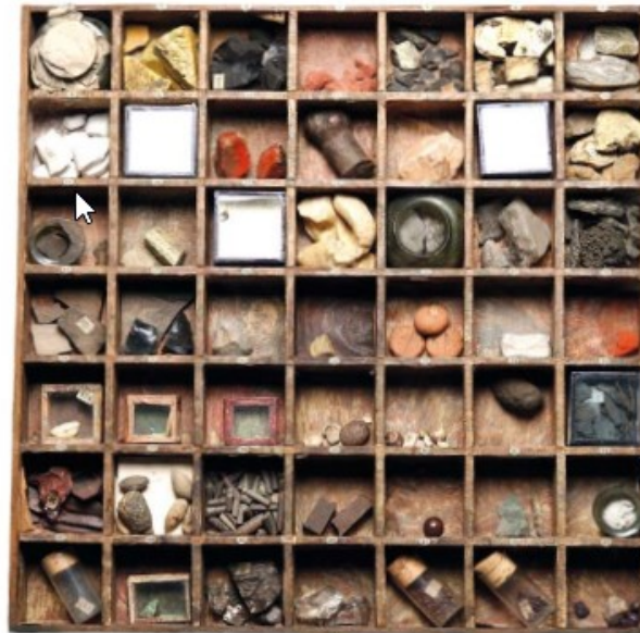
A specimen collecting tray.